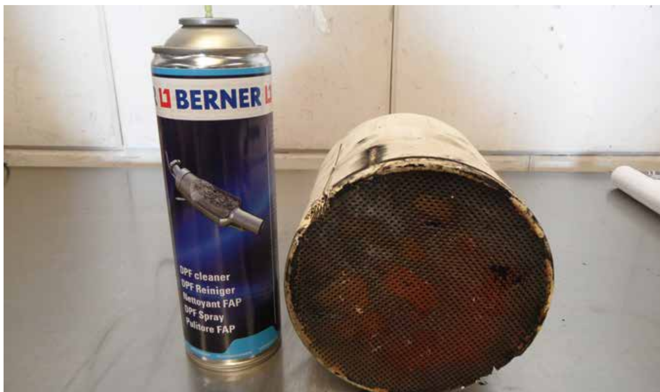
Gebruik oude onderdelen om tekst en uitleg te geven aan de klant, ze maken het probleem zichtbaar.