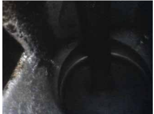
Een schone klepsteel en klepschotel na gebruik van Berner Benzine Additief PREMIUMline.