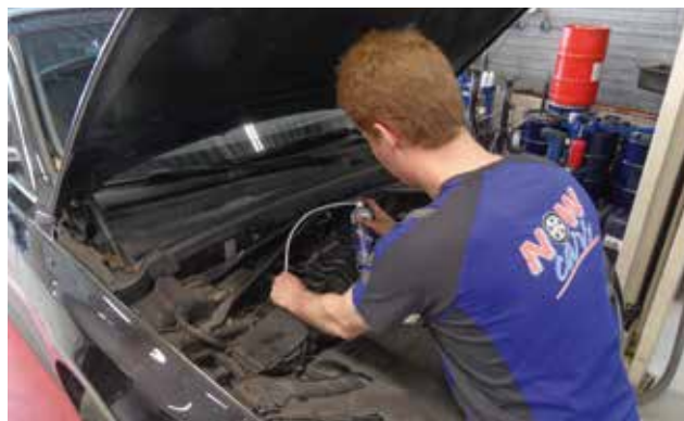
De spuitsonde en de slang van de DPF Reiniger zijn herbruikbaar en gemakkelijk in gebruik.