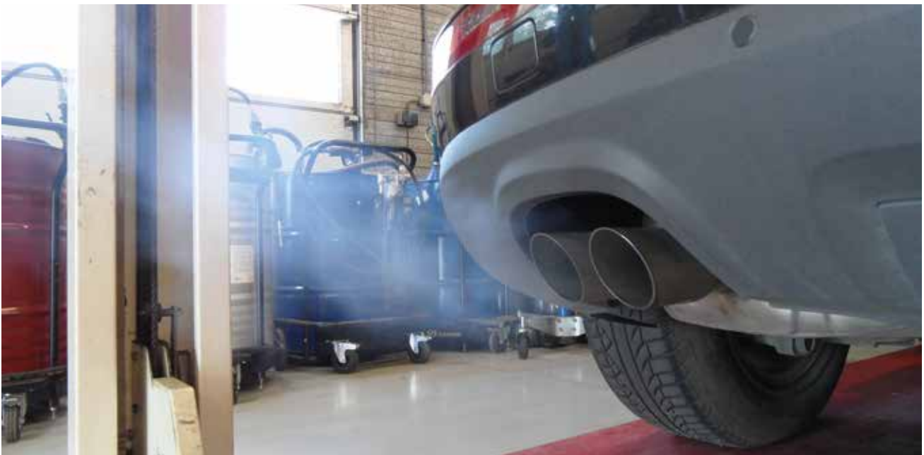
Witte rook. De DPF Reiniger doet zichtbaar zijn werk.