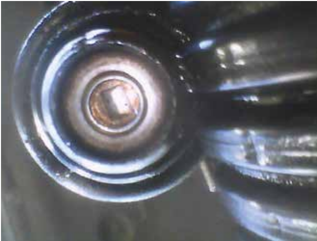
De injectorneus is schoon, het sproeibeeld weer optimaal.