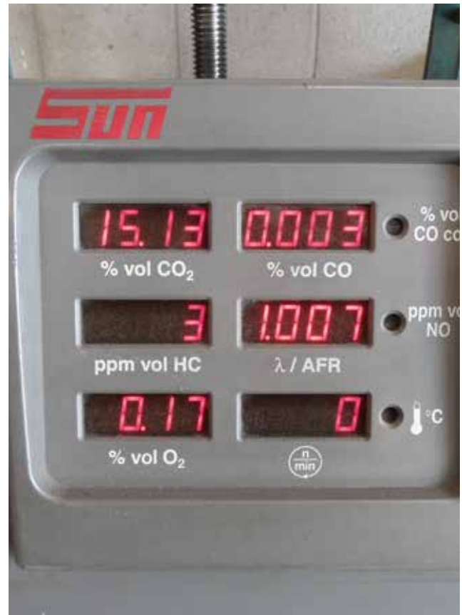
Het effect van het benzine additief is in de viergastest zichtbaar. Vóór behandeling (links) zijn zowel de CO als HC-waarde beduidend hoger dan daarna.