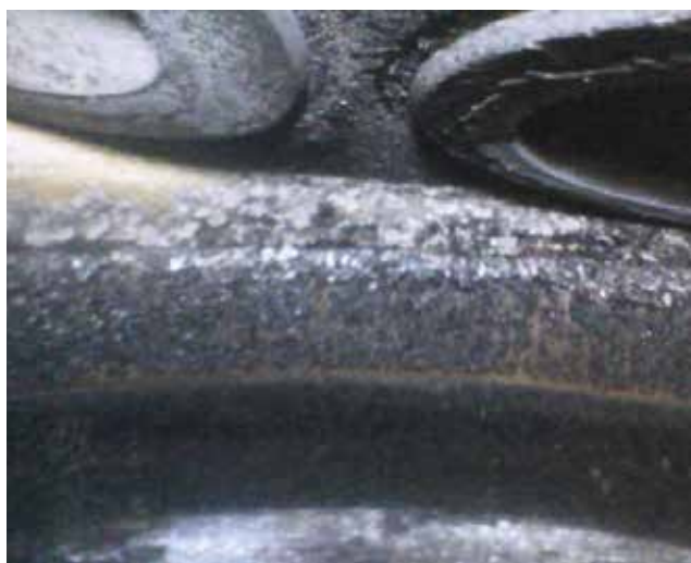
Een koolrand bovenin de cilinder en dikke afzetting op de klepschotels. Deze vervuiling is goed te reinigen met een additief.

Aan de hand van de nieuwe additievenrange van Berner laat Niels zien hoe en waarom je additieven in de praktijk toepast. In de werkplaats staat een Audi A6 2.4 V6 met automaat uit 2002. Een probleemloze auto die bij de APK moeite had met de viergastest. Het vermoeden bestaat dat het sproeibeeld van de injectoren een onvolledige brandstofmenging en dus een niet-optimale verbranding veroorzaakt. Uit het klantgesprek blijkt dat de auto hoofdzakelijk op zondag van huis naar de kerk en vice versa rijdt. Korte ritten, koude motor en lage toerentallen: het recept voor het opbouwen van inwendige vervuiling.