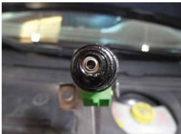
Een natte neus en veel lakafzetting rondom de injector verstoren het sproeibeeld.