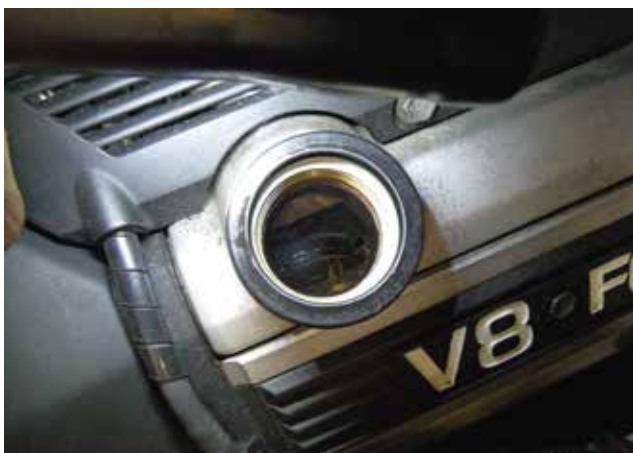
Lakafzetting onder de vuldop: controleer de onderhoudshistorie en gebruik MoS 2 -additief om het smeersysteem te reinigen.

Additieven zijn geen lapmiddelen meer om op een noodzakelijke reparatie te bezuinigen, maar volwaardige gereedschappen waar zowel de voertuigeige-