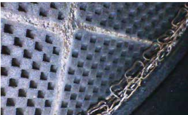
De metalen structuren in het DPF zijn zichtbaar, de kanalen zijn weer open.